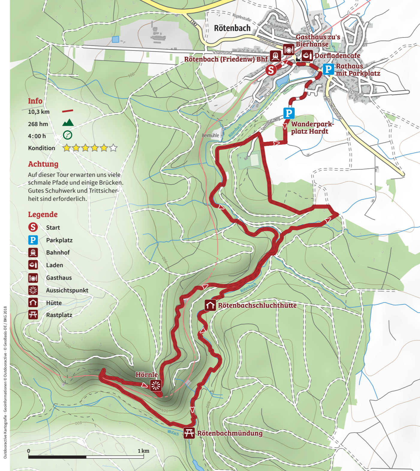
Outdooractive Kartografie - Geoinformationen