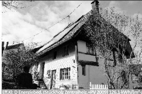
Eff.Kl: D Energiebed. (Stückholz Zentralheiz.+PV 2009) 126,1 kWh/(m²·a)